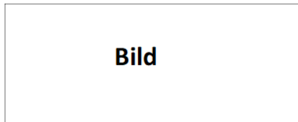
Abb. 2: Claude Monet: Das Parlament, Sonnenuntergang 2

Kurzbeleg in der Fußnote für Bild eines Künstlers/einer Künstlerin aus dem Internet