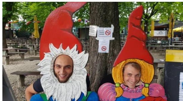
Abb. 5: Lustige Zwergerl-Lehrer der Schmelz

Von VWA-Kandidaten/in selbst erstellte Abbildung (Fotos oder Tabellen), Vermerk im Text der Fußnote (Abb. 6) oder Vermerk (Tabelle: Verf./Foto: Verf.) kann direkt bei Beschriftung (Abb. 5) angegeben werden; erscheint dann auch im Abbildungsverzeichnis (wenn vorhanden).