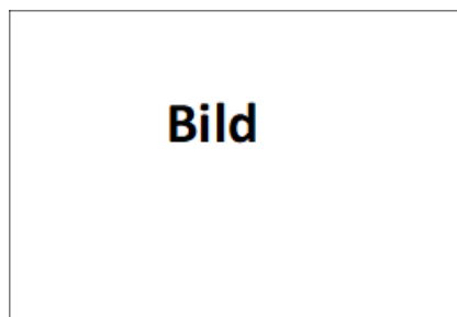
Abb. 1: (ev. Name d. Künstlers/in:) Titel des Bildes 1

Kurzbeleg in der Fußnote für Bild eines Künstlers/einer Künstlerin aus einem Sammelband/Katalog mit Herausgeber/in oder Künstler/in ist auch Autor/in des Buches