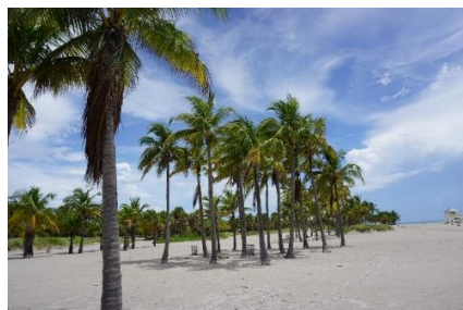
Abb. 6: Strand auf Key Biscayne in Florida 5